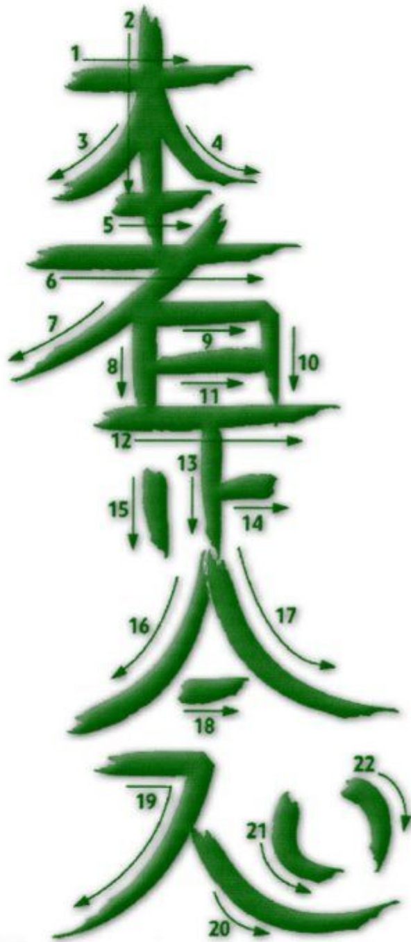
Hon Sha Ze Sho Nen Hon Sha Ze Sho Nen Hon Sha Ze Sho Nen