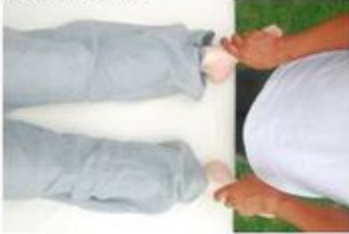
Plantas de los pies